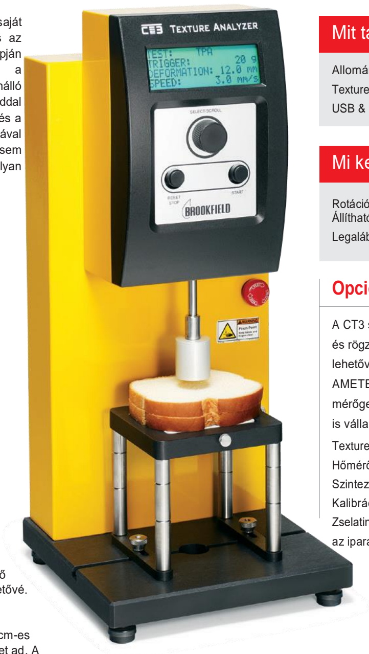
CT3 Alkatrész Állvánnyal Hengeres szonda kompressziós (TPA) módban

teszik lehetővé a nagyobb mintamennyiséget és több kiegészítő tartozék használatát